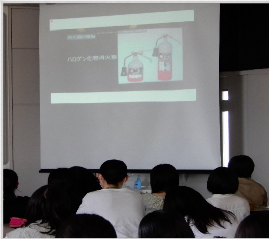
消火器や消火栓の使用方法について学習しました。 この後、校舎の避難経路と避難方法について、みんなで確認しました。

看護師になれば自分たちが主体となって患者様を避難誘導できるよう、普段から防災への意識を高め、「いざ」という時に行動できるよう、今回の訓練を活かしていきます。