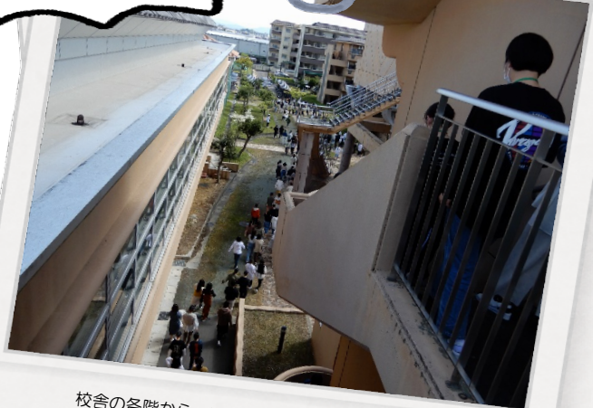
校舎の各階から、避難場所まで移動します。