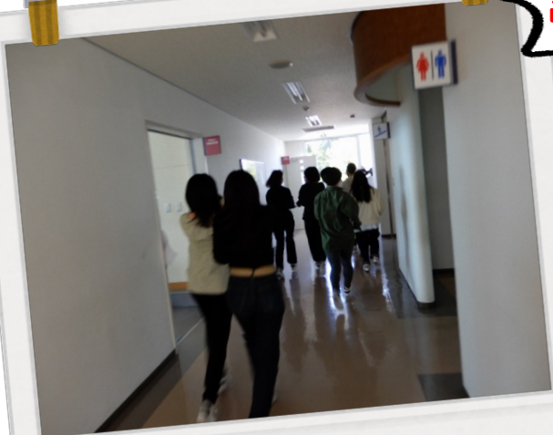
口をハンカチでおさえて・・・ 気持ちはあせるけど、落ち着いて。